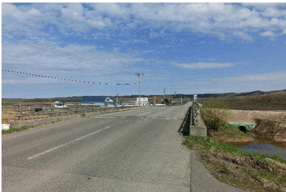
* 対岸の西5線側から見た橋の正面