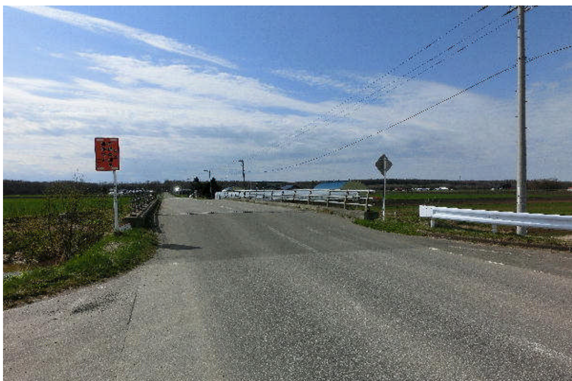
* 共立会館から10号を奥に行った西4線側から見た橋の正面

■道道北見常呂線脇にある共立会館から10号線と西4線が交わるすぐ先にある橋で、昭和56年11月の竣工です。