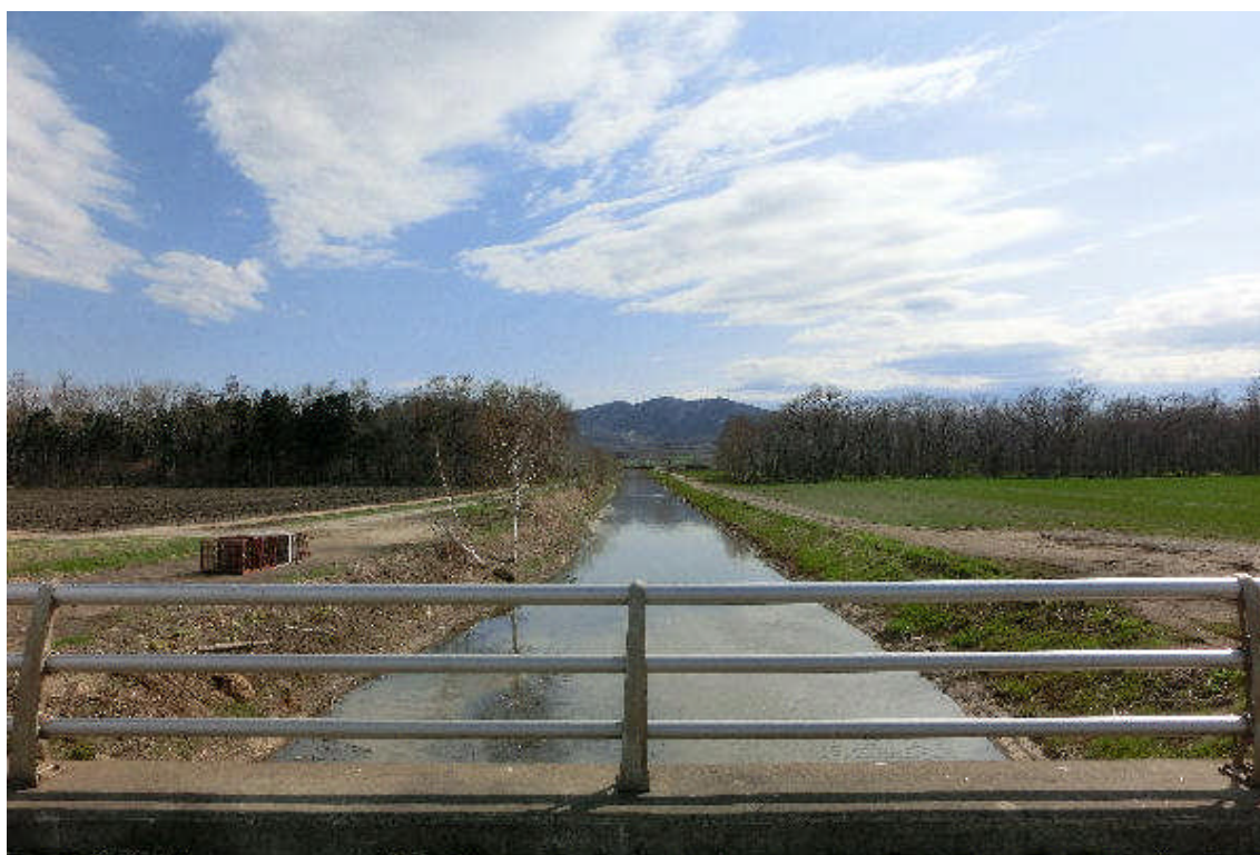
* 橋の上から上流（11号：イワケシュ山方面）を見て