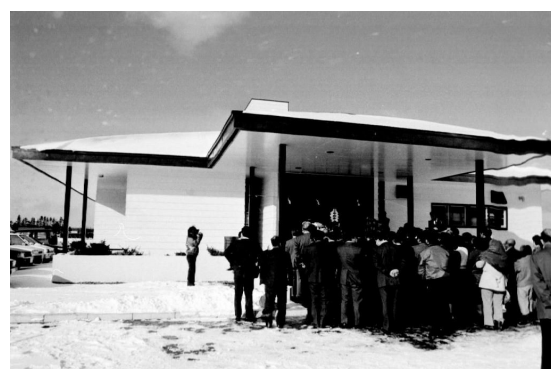
*上2枚：落成式典前の修祓式