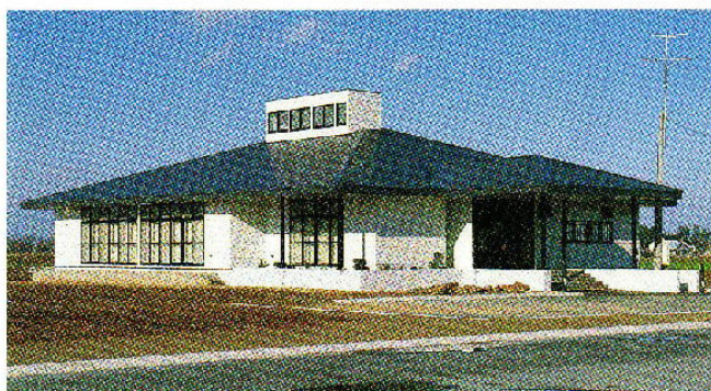
豊川地域農村環境改善センター建設委員会

日 時 平成元年12月10日(日) 修 拔 式 10:30~11:00 祝 賀 会 11:30~13:00 場 所 常呂町字豊川 豊川地域農村環境改善センター