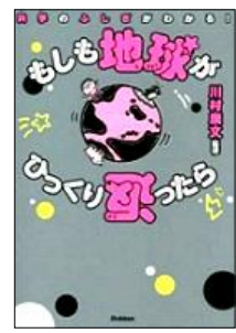
かわむら やすふみ かんしゅう 川村 康文 / 監修