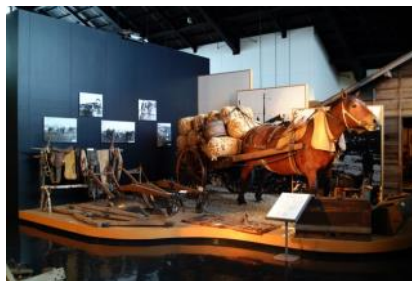
→1万年前の土器・石器（端野の畑から