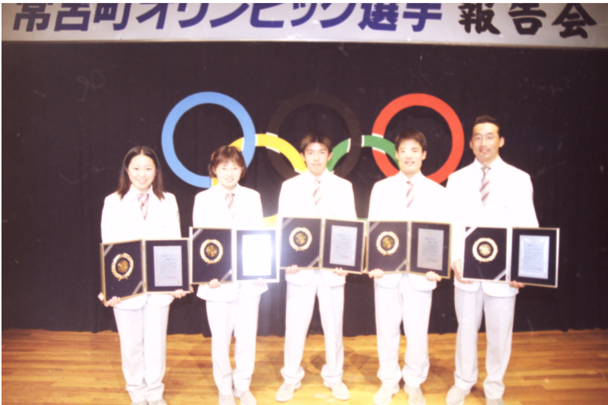
*上：平成10年3月9日 オリンピック選手報告会（多目的研修センター）

*次ページからは、広報3月号で特集した5人のオリンピック選手の活躍を添付します。（男女予選ラウンドの対戦成績表付き）