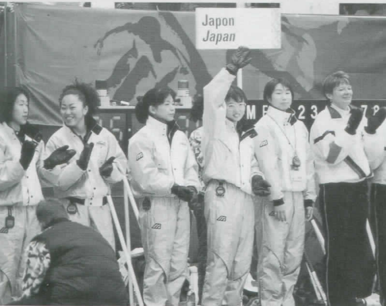
【日本女子】予選ラウンド 2勝5敗 第5位