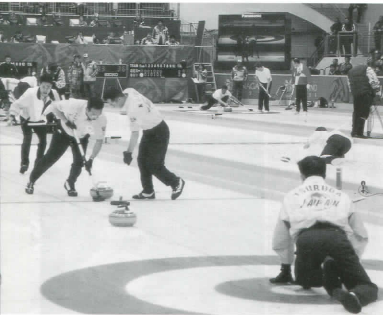
【日本男子】予選ラウンド 3勝4敗 第5位