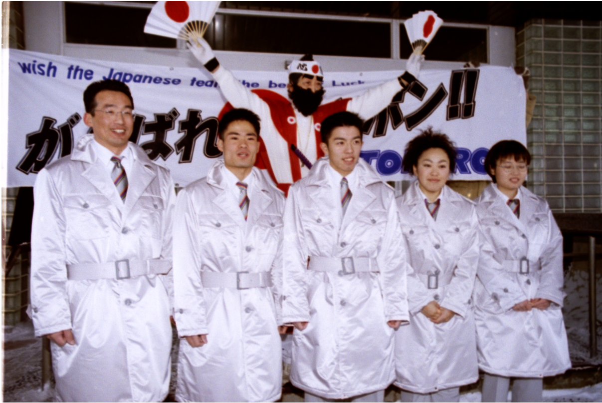
*上：平成10年2月4日 常呂町役場前での出発式