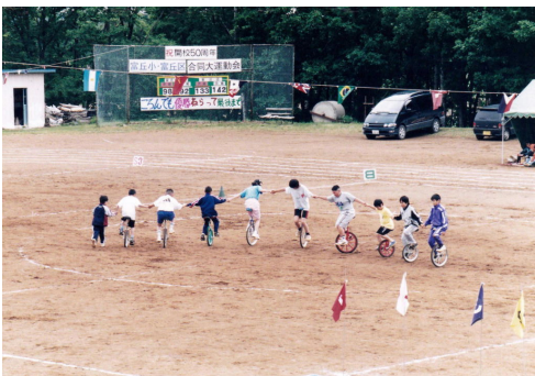
*上・右 6月20日、地域の人たち と合同の運動会 上はグラウンドでの一輪車 の演技