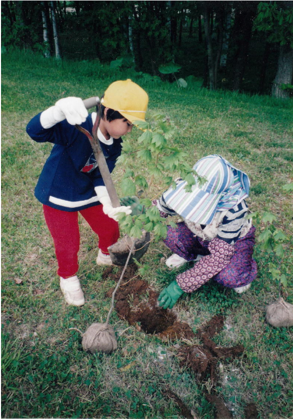
*左：6月5日 父母・老人クラブも一緒に行った記念植樹