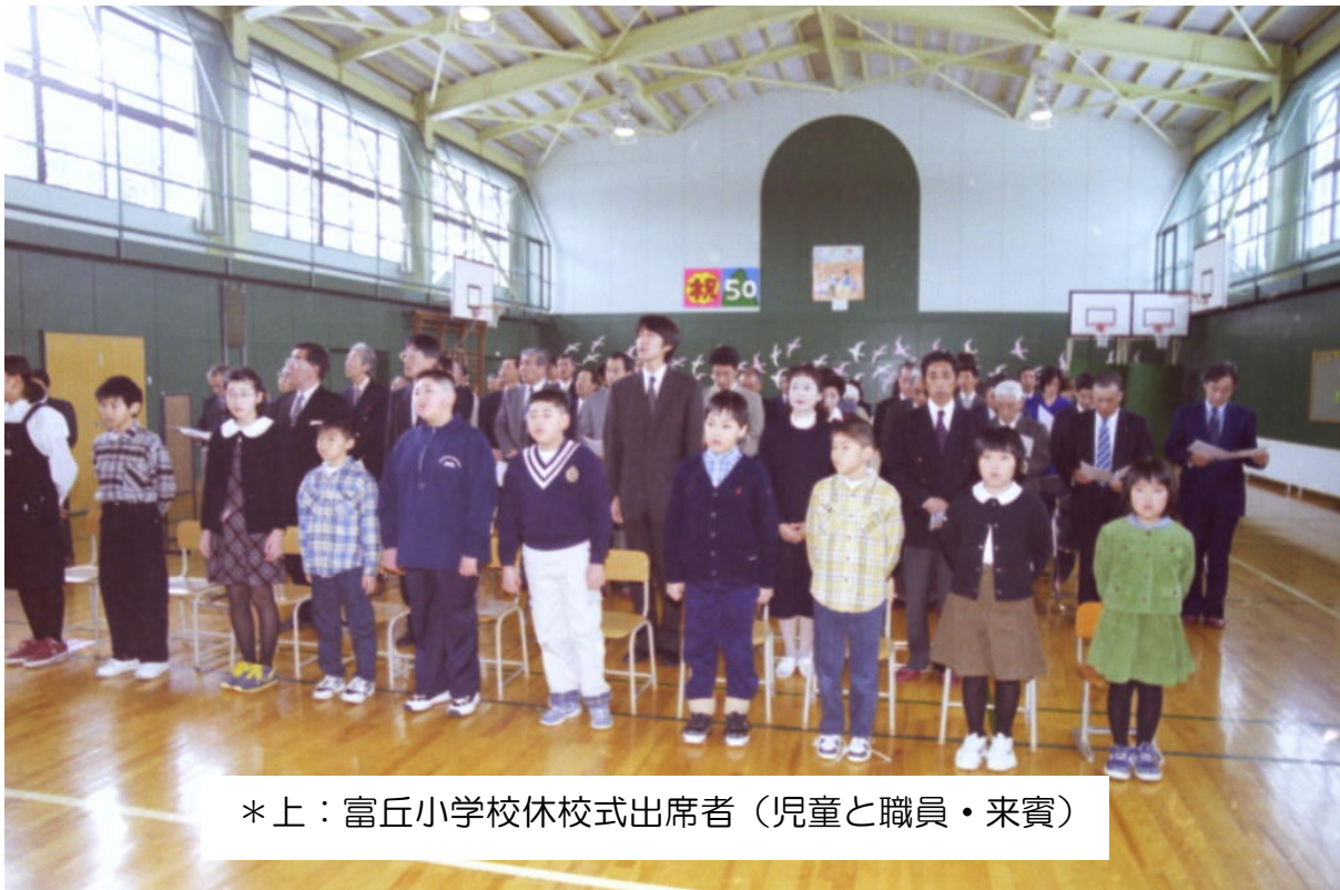
*上：富丘小学校休校式出席者（児童と職員・来賓）