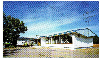
常呂町立富丘小学校

平成12年3月20日(月) ○休校式 午前11時より 於：富丘小学校体育館 ○披露の宴 12時より 於：富丘区コミュニティセンター