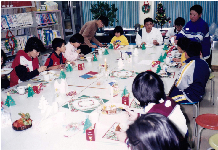
*左・下 12月のクリスマス集会 体育館でゲーム、特別教室で パーティ