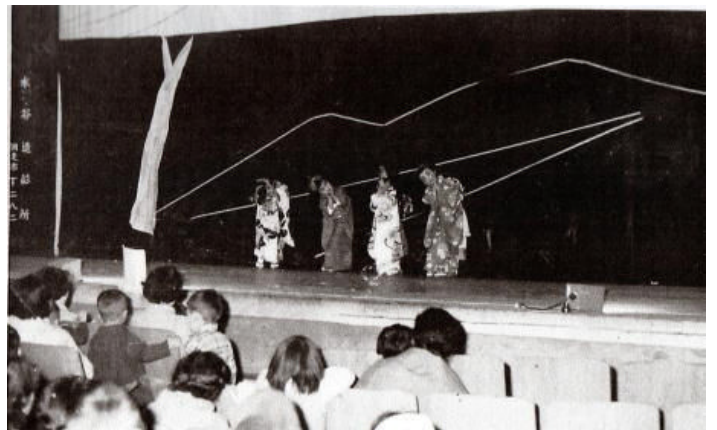
*上2枚：常呂シネマ（場所は現在の網走信金）で行った学芸会

●白鳩保育園に続き、子どもの数の多さと保育・幼児教育への要望・希望の大きさにより、町内各地に地域主体の保育園と私立幼稚園が開園します。