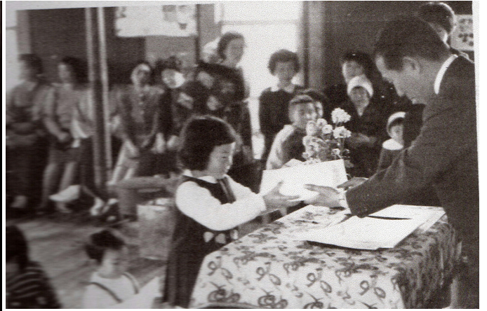
*上下4枚：昭和35年12月の修了式 クリスマスの催しと兼ねていました