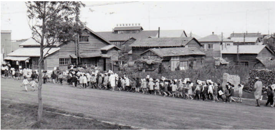
*左：上の写真に続く 常呂小前の道路 *左端は旧小山内商店 奥に見える背の高い建物は 大沢木材工場 *下：現田中電器・総合 支所付近