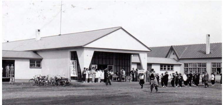
*上2枚、右横、下2枚の写真は、 旗行列のゴールで式典会場となった 常呂高校でのようす