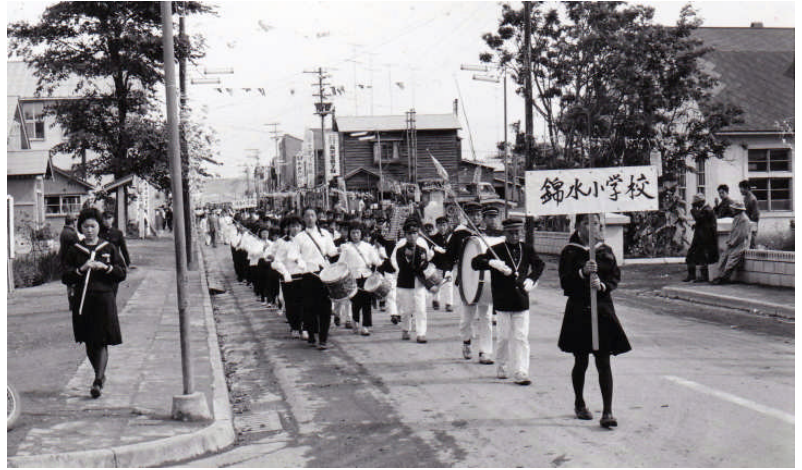
*上・左：役場（現総合支所前）