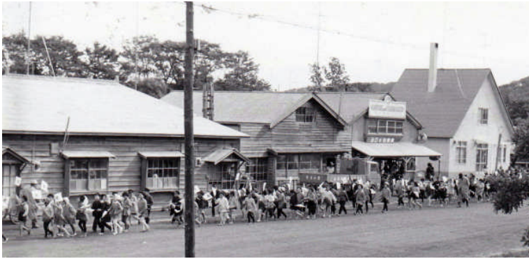
*左上：役場前 上：駅前商店街 *左：常呂小学校旧正門前付近