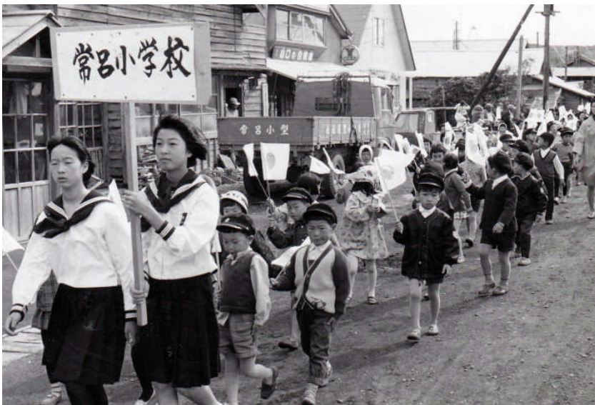
*下：常呂小学校旧正門 前（現山内電器サービス）