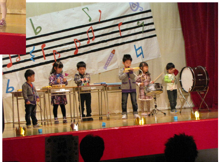
※日吉保育所は、子どもたちの人数が 減り、平成25年3月に閉園しました。