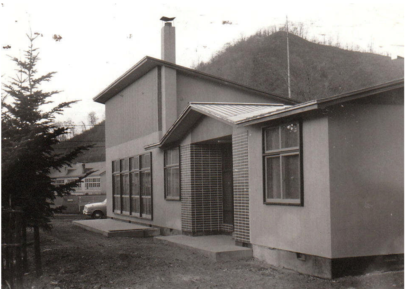
*下：完成後の 母と子の家 （日吉保育所）