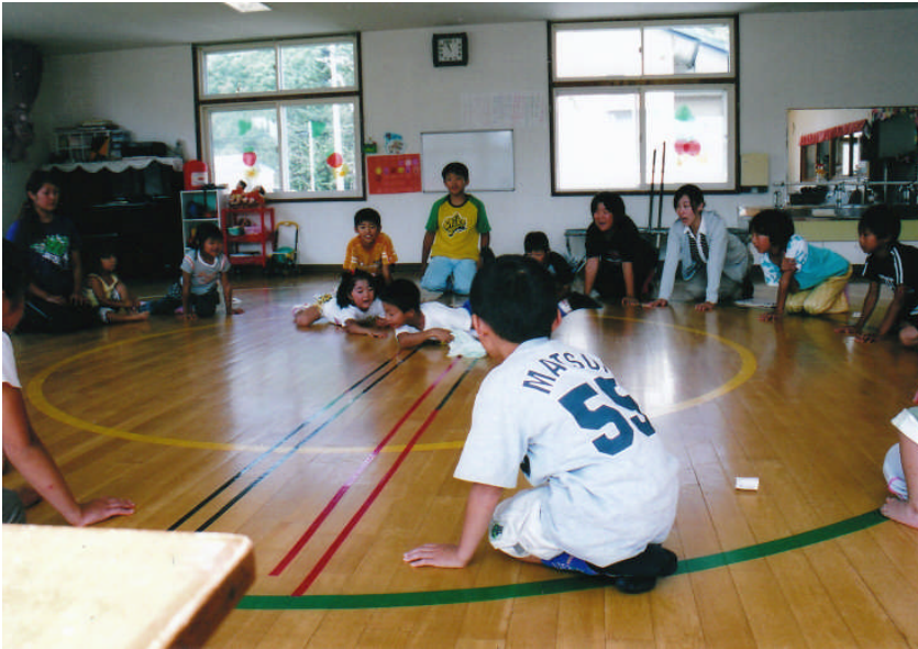
*左：平成17年9月12日 日吉小学校児童と日吉 保育所園児の交流会 （会場：日吉保育所）