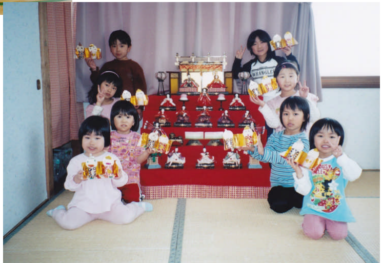
*右：平成19年3月 日吉保育所園児の ひな祭り