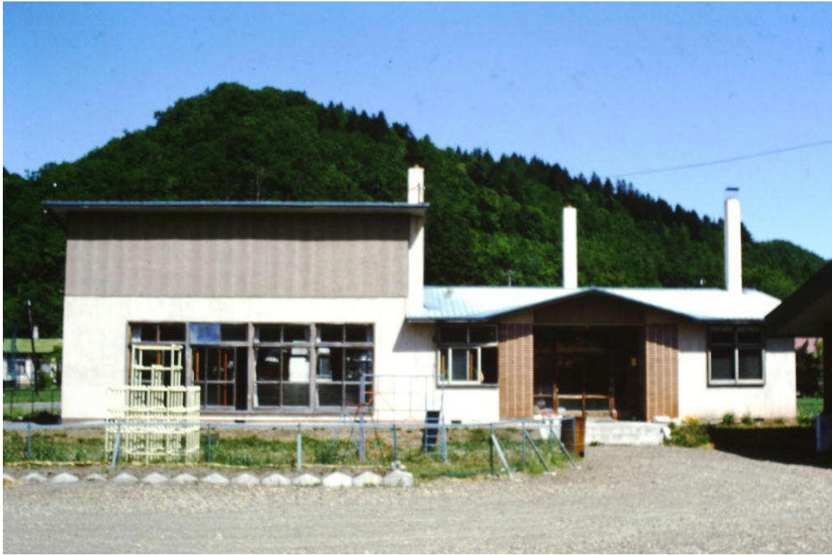
*上：正面から見た日吉保育所（年代不明）