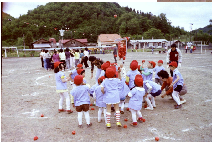
*左：昭和51年6月27日 日吉保育所・日吉小学校・日吉地区 合同運動会