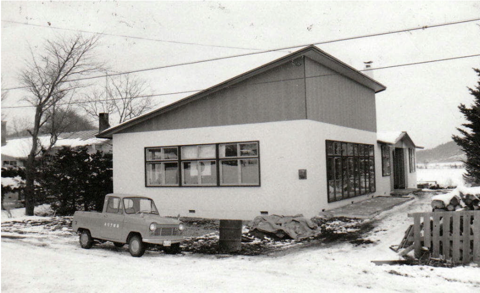
*左：建設工事中の 母と子の家 （日吉小の方から見て）

●昭和40年の日吉保育所の開園以降、翌年には、日吉・豊川・岐阜の3へき地季節保育所が町営に移行します。（それまでは地域主体の運営）●また、42年の日吉診療所解体と母と子の家の建設中、日吉小学校の図書室を間借りして保育をしていました。