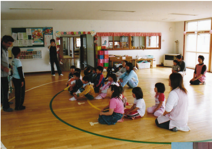
*左：平成19年9月20日 日吉小学校児童と日吉保育所園児 の交流会（会場：日吉保育所）