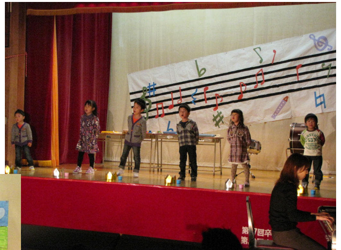
*右・下・右下 平成23年11月20日 日吉保育所のおゆうぎ会 （会場：日吉小学校） 常呂図書館で所蔵している日吉保育所 の写真では最後の行事