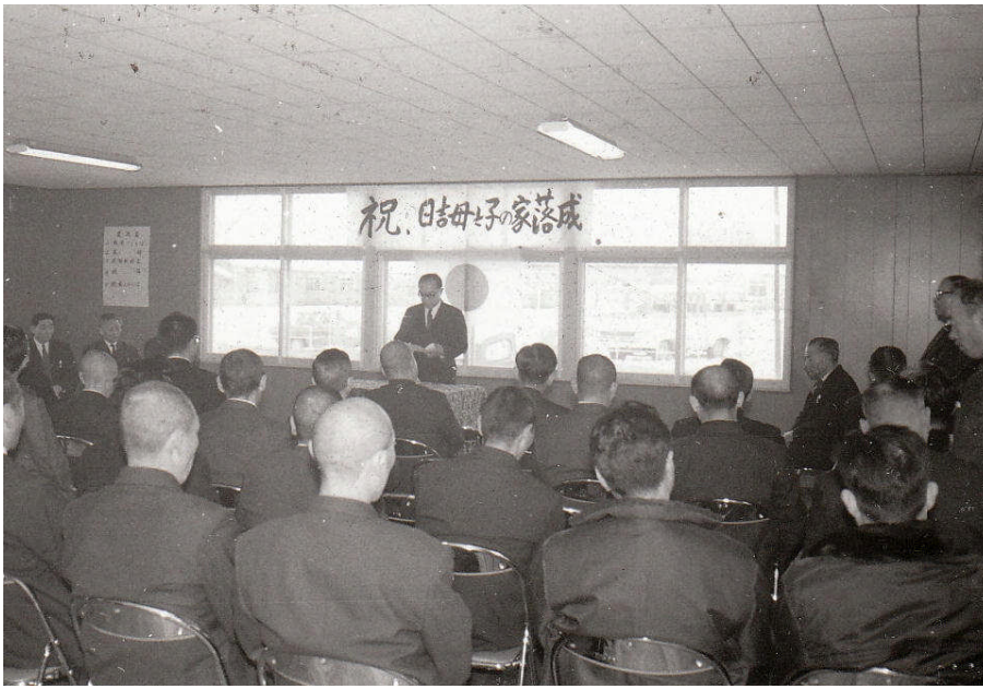
*左：母子の家の 落成式典